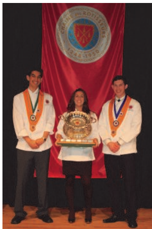
2009 National Jeunes Chefs Competition Winners Victoria BC Canada

Soirée Gala du Grand Chapitre National - Cérémonie du Concours National des Jeunes Chefs - Cérémonie d'intronisation à l'Hôtel Fairmont de Vancouver 5.00 hres p.m. L'équipe Culinaire ainsi que celle du Service feront de cet événement une soirée inoubliable. $245.00